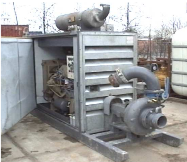
Anlage PH6x5D mit 100 kW Diesel Leistung 250 m 3 /St – 7 bar